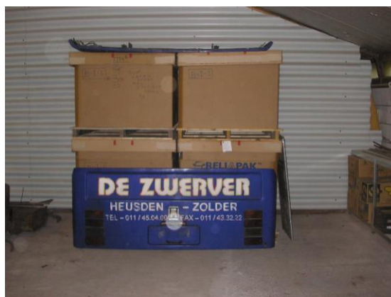
Opslag zittingen International en daarvoor van de sloop gehaald nieuw motorluik voor de Van Hool